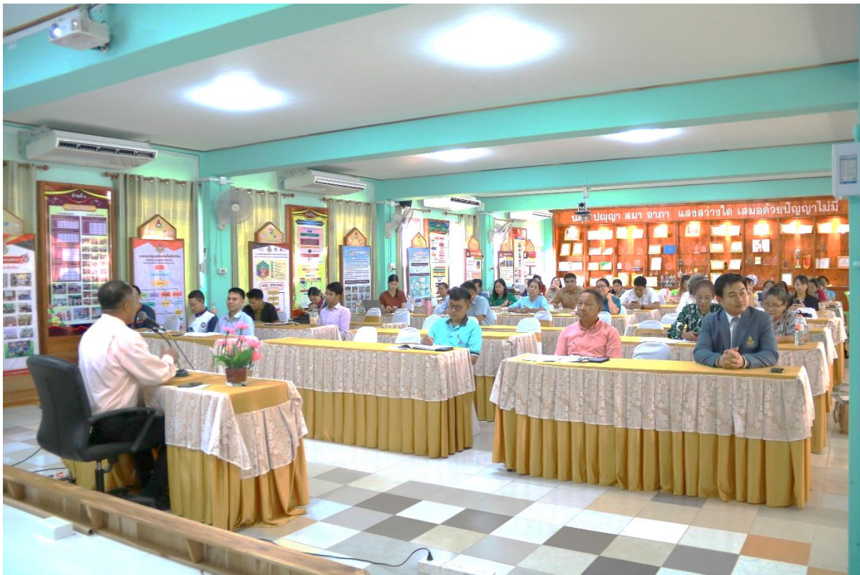
อบรมการพัฒนาสมรรถนะด้าน การป้องกันการทุจริตบรรจุเป็นวาระ การประชุมประจำเดือนของโรงเรียน